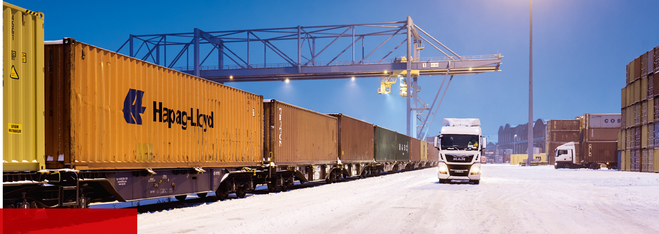
Bei jedem Wetter unterwegs: der OWX am Terminal in Duisburg.