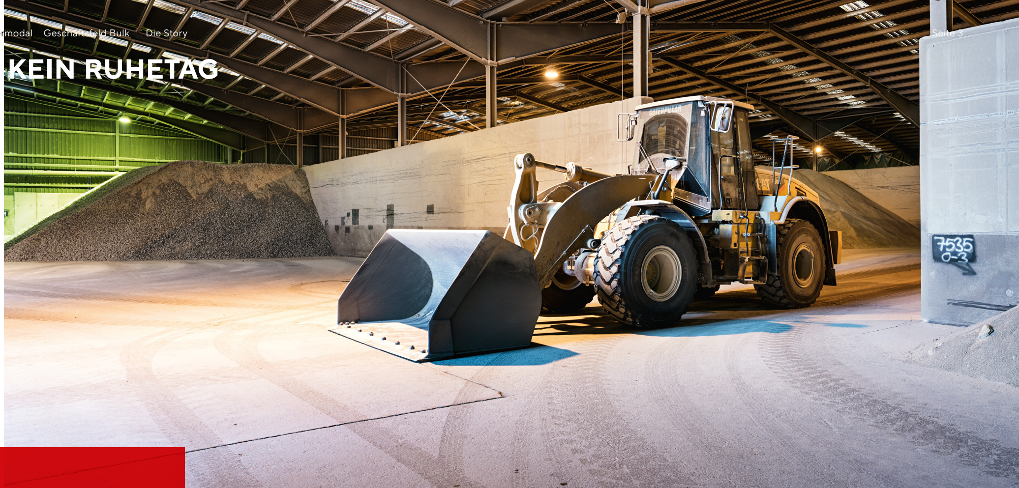
Blick in eine unserer riesigen Schüttgut-Lagerhallen.

Wie wir auch zu ungewöhnlichen Zeiten die Probleme unserer Kunden lösen.